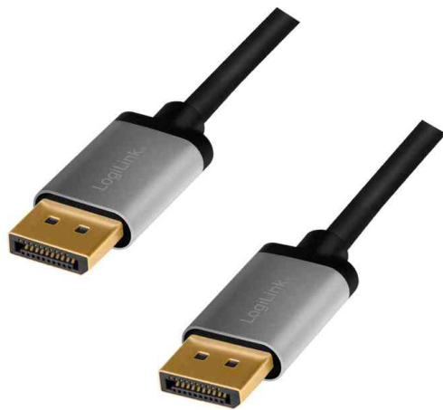
DisplayPort 1.2 Anschlusskabel