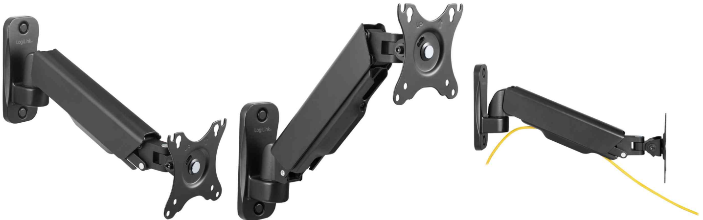
Monitorarm zur Wandmontage