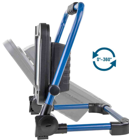
LED Akku-Arbeitsstrahler LUMINARY FL4500R, mit Verstellwinkel