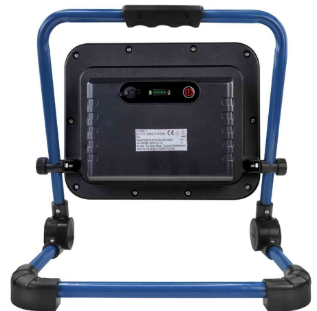
LED Akku-Arbeitsstrahler LUMINARY FL4500R, Rückansicht