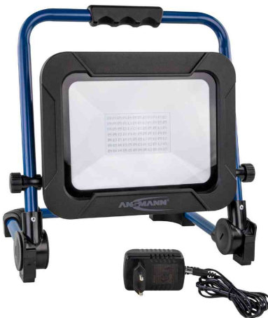
LED Akku-Arbeitsstrahler LUMINARY FL4500R