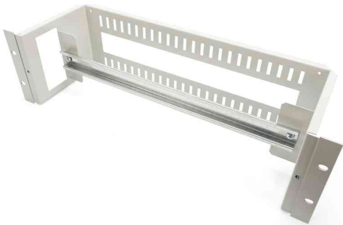
19" Hutschienenträger, 3HE