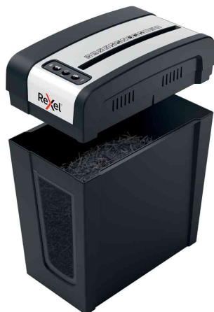
Aktenvernichter Secure MC4-SL Slim Line, offen