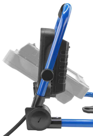
LED-Arbeitsstrahler LUMINARY FL2400AC, Seitenansicht