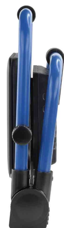
LED-Arbeitsstrahler LUMINARY FL2400AC, zusammenklappbar