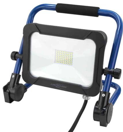
LED-Arbeitsstrahler LUMINARY FL2400AC