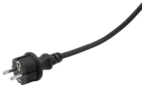
mit integriertem H07RN-F Gummikabel