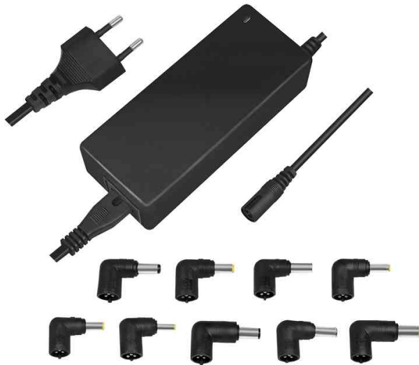
Universal Netzteil für Notebooks, 90 Watt

- schlankes und leichtes Ersatzgerät oder zweites Netzteil für Zuhause, im Büro oder auf Reisen