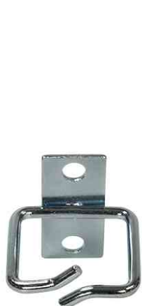
19" Kabelführungsbügel-Set, 40 x 40 mm