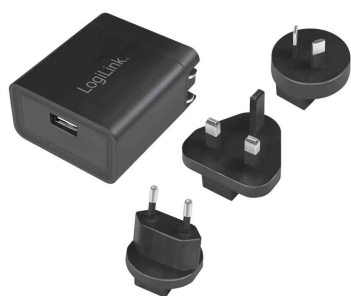
USB-Reisestecker mit 2,1A Fast Charging