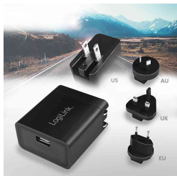
USB-Reisestecker mit 2,1A Fast Charging