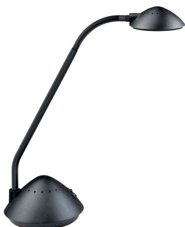
LED-Tischleuchte MAULarc, schwarz