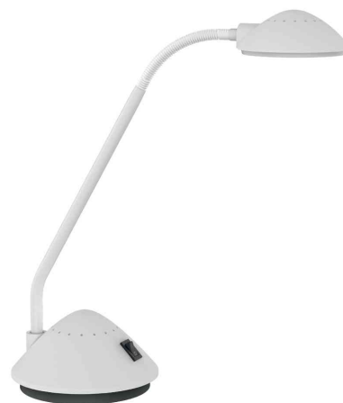
LED-Tischleuchte MAULarc, weiß