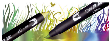
Mit 2 Spitzen