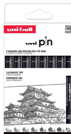
Fineliner-Set PIN PF ASP010, 8er Set