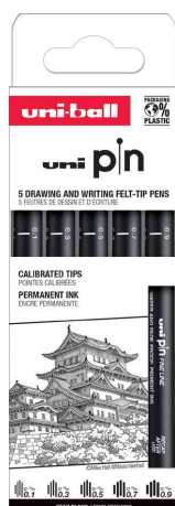
Fineliner-Set PIN PF ASP008, 5er Set