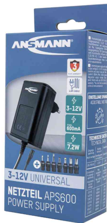
Universal-Steckernetzteil APS 600 (ErP Level VI), in Verpackung