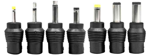
inkl. 7 verschiedenen Steckertypen