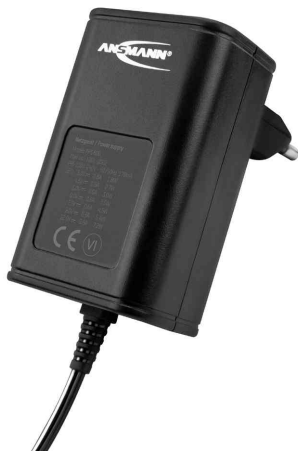
Universal-Steckernetzteil APS 600 (ErP Level VI)