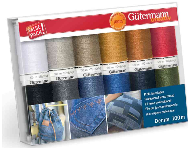
Nähfaden-Set "Denim", 12 Spulen