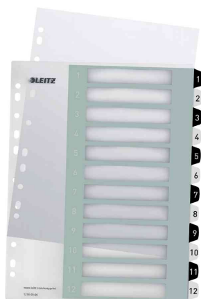
Zahlen Kunststoff-Register WOW, 1 - 12