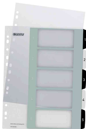
Zahlen Kunststoff-Register WOW, 1 - 5

Hinweis: Deckblatt kann gestaltet werden unter: www.leitz.com/easyprint