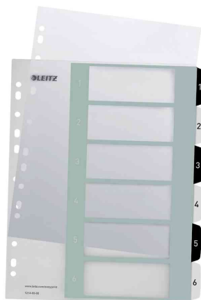
Zahlen Kunststoff-Register WOW, 1 - 6