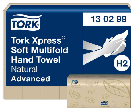
Xpress Multifold Handtuchpapier, natur