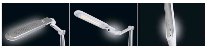
Detailansicht - Leuchtenkopf / Steuerung