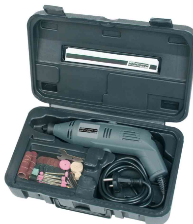
Schnellschleif-Gerät-Satz, im Aufbewahrungskoffer