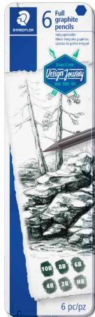
Graphitstift Mars Lumograph pure graphite, 6er Metalletui