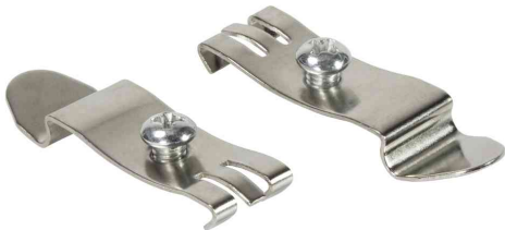
Hutschienenhalter mit Befestigungsschraube (M5), 2er Set

- um Geräte an Standard Hutschienen zu befestigen wie z.B. Mini Patch Panels