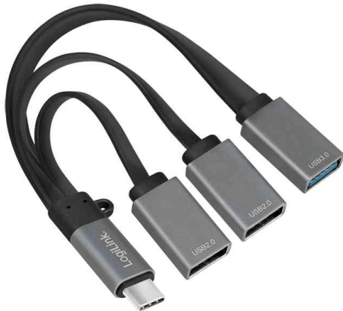
USB 3.0 Hub mit USB-C 3.1 Gen1 Anschluss, 3 Port