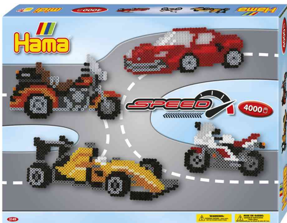
Bügelperlen midi "Speed", Geschenkpackung

Für Verbraucher gemäß EU-Spielzeug-Richtlinie (2009/48/EG): ACHTUNG! Nicht geeignet für Kinder unter 36 Monaten, wegen verschluckbarer Kleinteile.