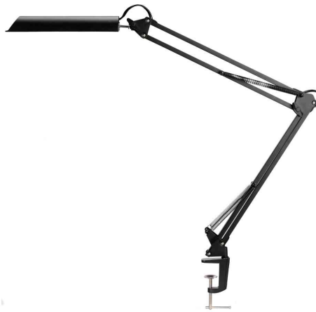
LED-Tischleuchte SWINGO, schwarz, Tischklemme