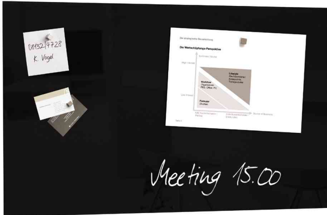
Glas-Magnettafel "artverum", schwarz