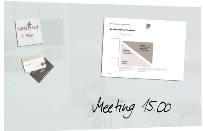
Glas-Magnettafel "artverum", weiß