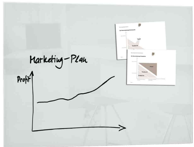
Glas-Magnettafel "artverum", weiß