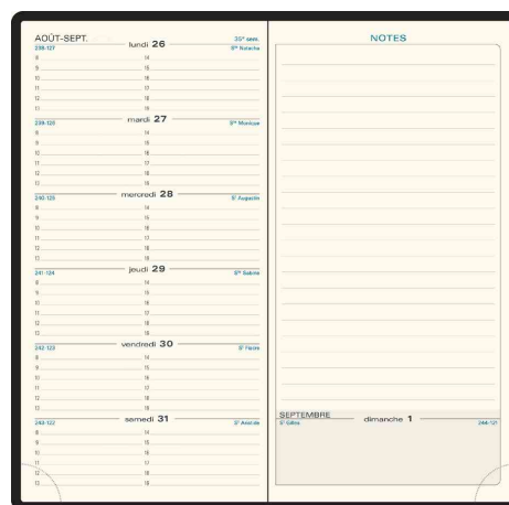
Agenda de poche "Espace 17" Cassandra - 175 x 90 mm, grille