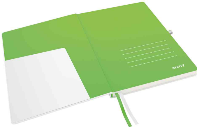
Innentasche im Vorderdeckel