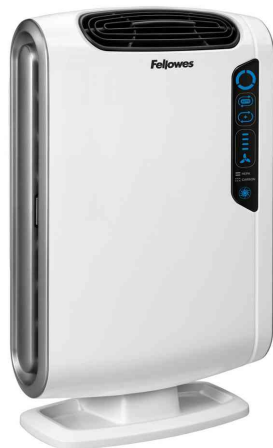
Luftreiniger AeraMax DX55