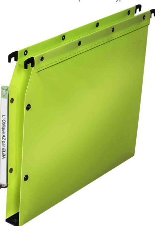
Visuel de référence: Dossiers suspendus Polypro V Ultimate, vert