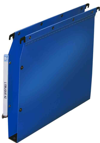
Visuel de référence: Dossiers suspendus Polypro V Ultimate, bleu