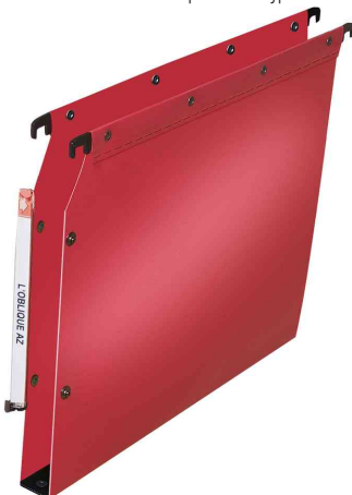
Visuel de référence: Dossiers suspendus Polypro V Ultimate, rouge