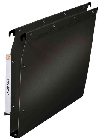
Visuel de référence: Dossiers suspendus Polypro V Ultimate, noir