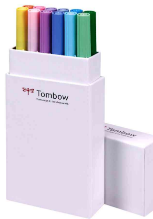
Fasermaler "ABT DUAL BRUSH PEN", 12er-Set Pastellfarben