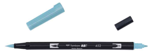
mit 2 Spitzen