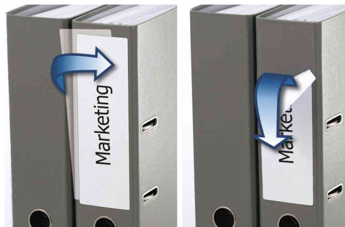
Orderrücken-Etiketten SPECIAL, Anwendung