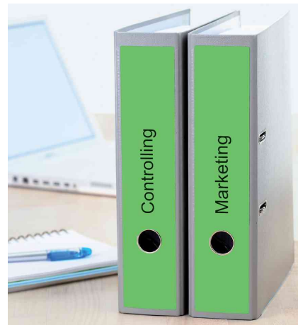
Orderrücken-Etiketten SPECIAL, Anwendung