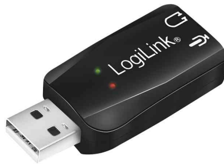
USB 2.0 Audioadapter, 5.1 Soundeffekt