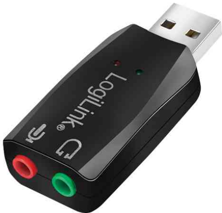
USB 2.0 Audioadapter, 5.1 Soundeffekt