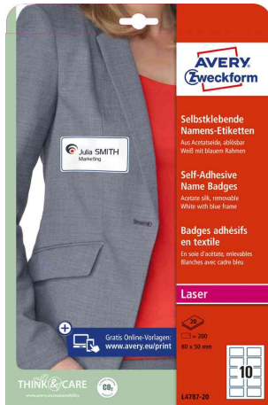
Namensetiketten, mit blauem Rahmen