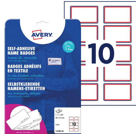
Namensetiketten, mit rotem Rahmen